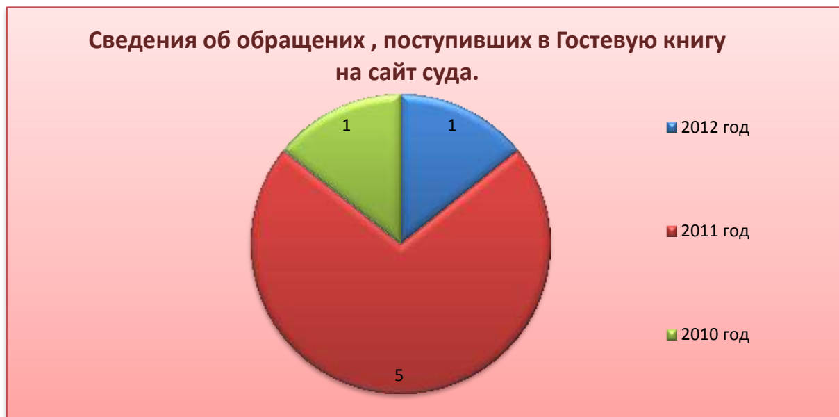
Рис.3 Динамика обращений поступивших в Гостевую книгу на официальном сайте суда за 2010-2012 год.

Количество обращений, оставленных в Гостевой книге в отчетном периоде 2011 года, превышает данные 2010 и 2012 года.